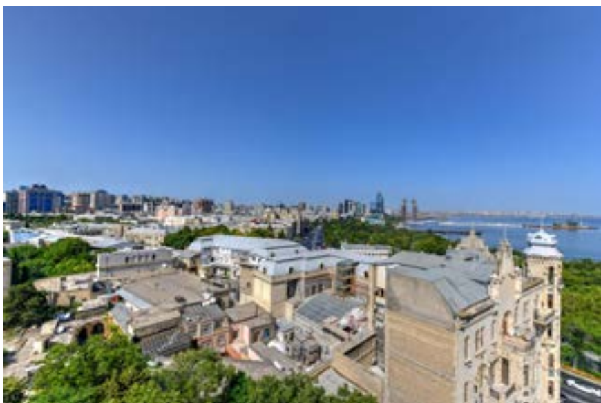
Centre-ville de Bakou (Azerbaïdjan) 3 .