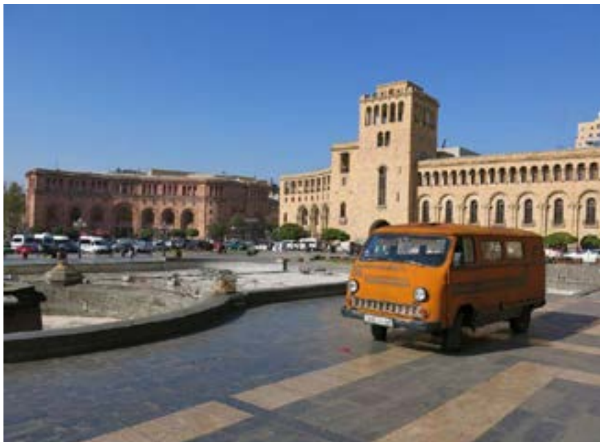
Cœur d'Erevan (Arménie) 4

Il faut remonter aux décisions de Joseph Staline, alors commissaire du peuple aux nationalités, pour comprendre la situation qui prévaut. Tout à son principe de « diviser pour régner », il rattache en effet, en 1921, le Haut-Karabakh, peuplé majoritairement d'Arméniens, à l'Azerbaïdjan.